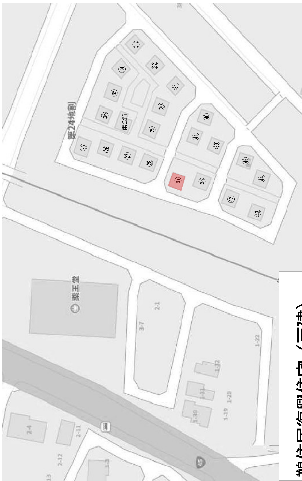
鵜住居復興住宅（戸建）