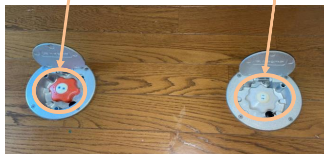
トイレ前又はバルコニードア前の床

※ パイプシャフトの写真は2・3号室のもので、 1・4号室は給水弁が単独で設置されています。