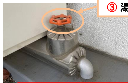
バルコニー 給湯器の下