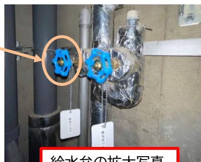
給水弁の拡大写真