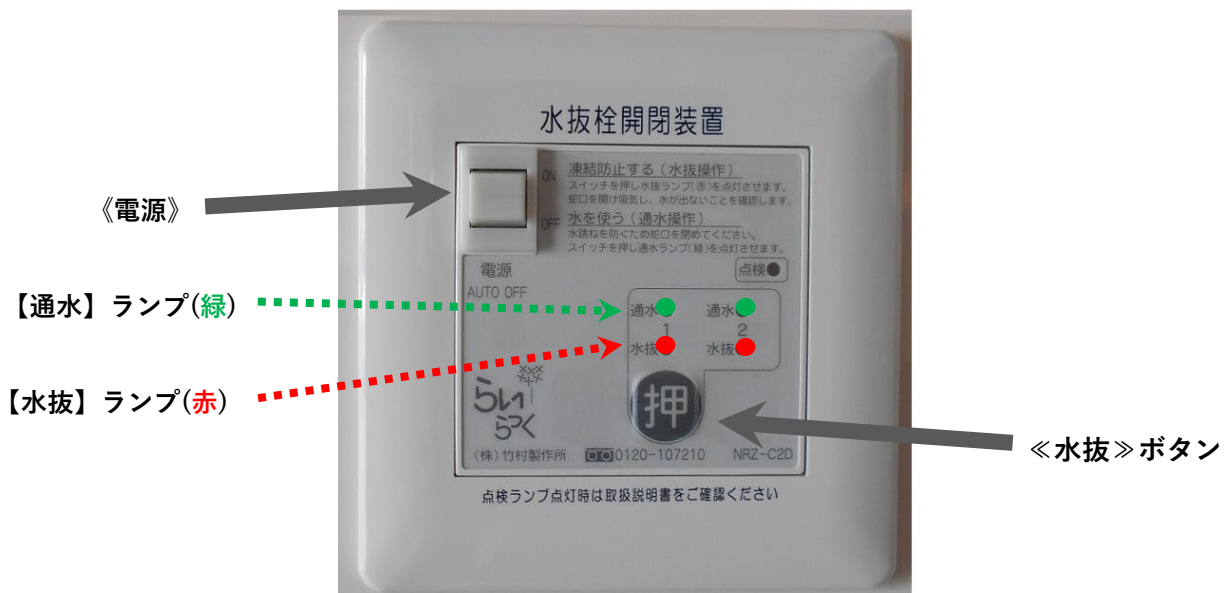
『水抜き操作リモコン』