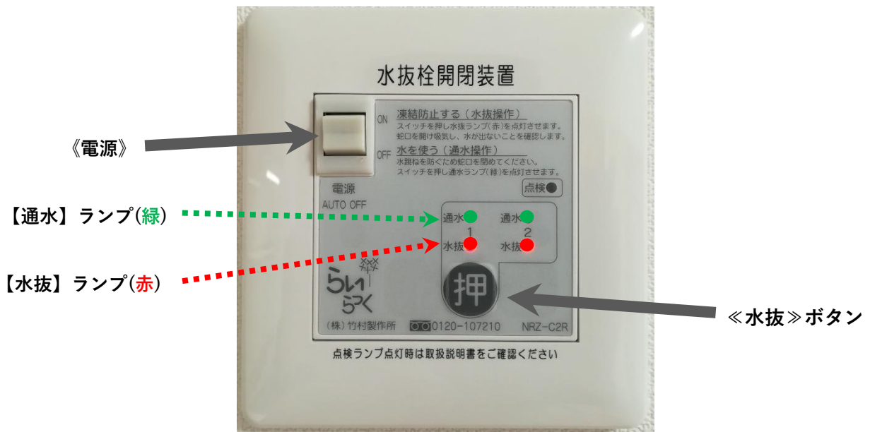
『水抜き操作リモコン』