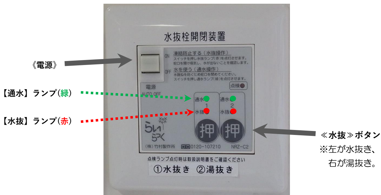
『水抜き操作リモコン』

⚠ 冬期間は、玄関ホーム分電盤内の凍結防止回路ブレーカーは下げないでください。 また、給湯器のコンセントを抜いたり、ブレーカーを下げたりしないでください。