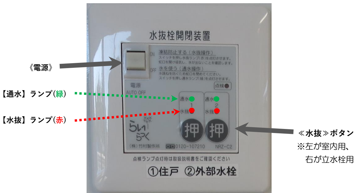
『水抜き操作リモコン』