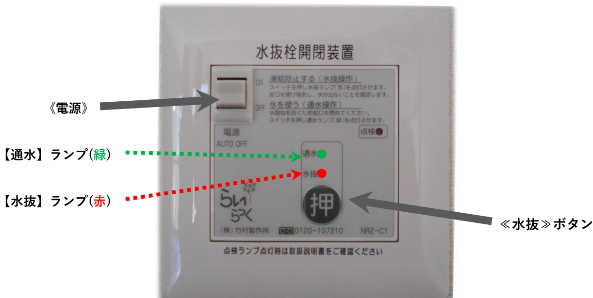
『水抜き操作リモコン』

⚠ 冬期間は、玄関ホーム分電盤内の凍結防止回路ブレーカーは下げないでください。 また、給湯器のコンセントを抜いたり、ブレーカーを下げたりしないでください。