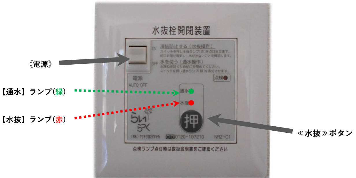
『水抜き操作リモコン』